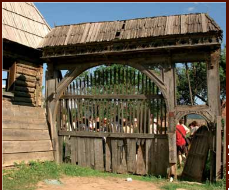
Csikmenaság, Adorjáni kúria kapuja