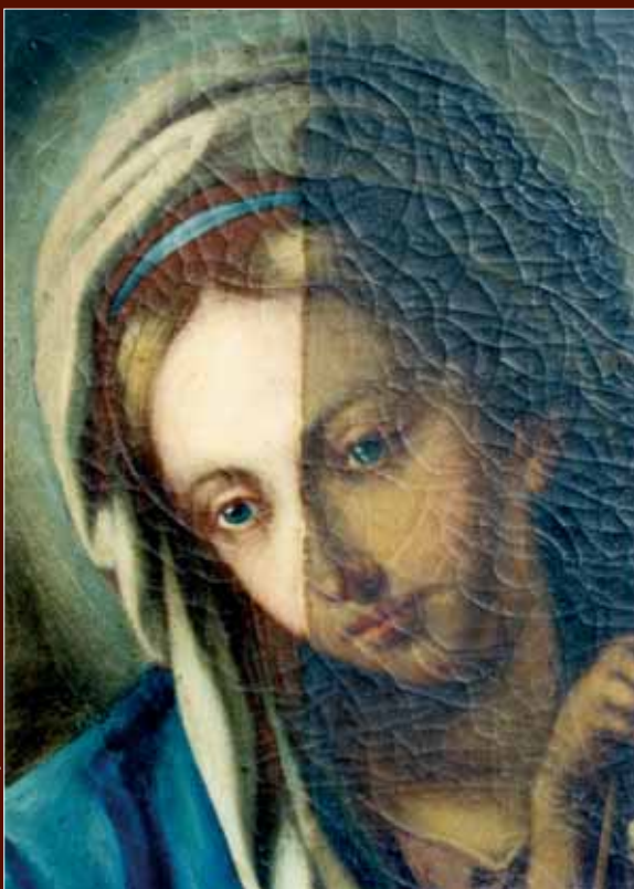
Restaurálás, ill. tisztítás közben, Marosvásárhely – Keresztelő Szent János plébániatemplom (cikk a 44. o.)