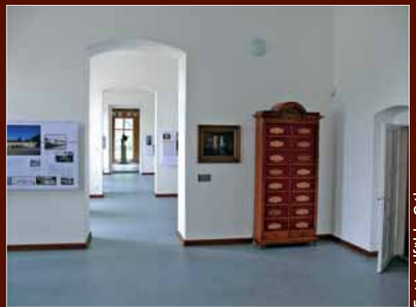
A Festetics-kastély most megnyitott földszinti teremsora Dégen