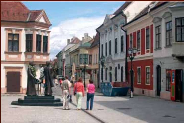
Győr, Széchenyi tér-Liszt Ferenc utca, piazzetta