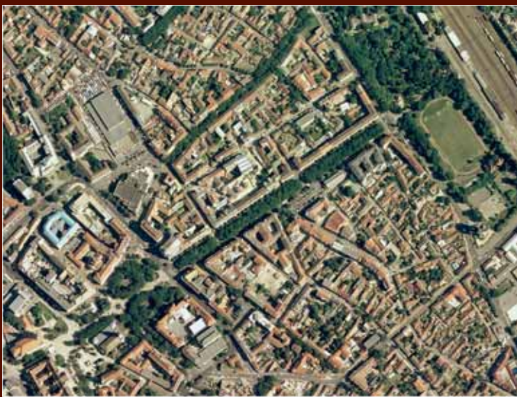
Kecskemét Fő tere a Rákóczi úttal