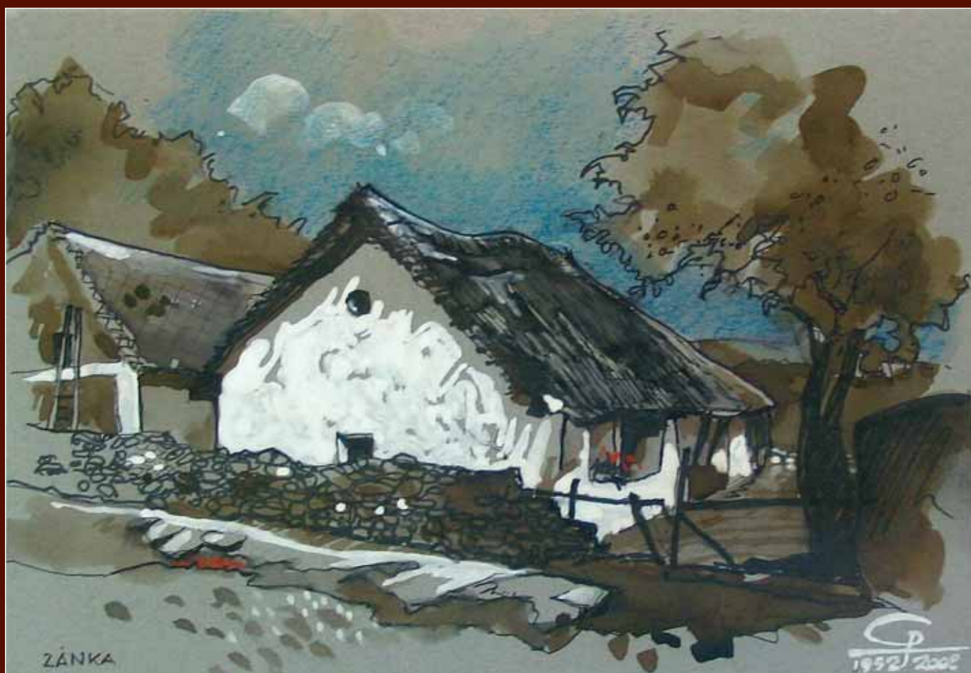
Zánka parasztház (1952)